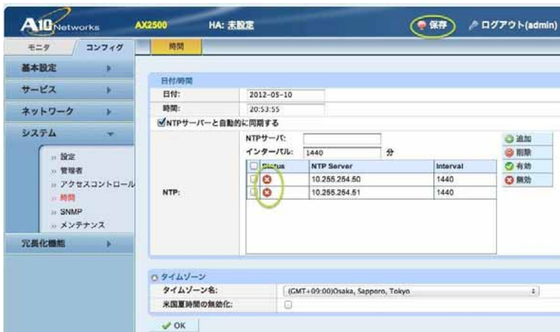
図 2 . 2 NTP 同期無効化後の画面