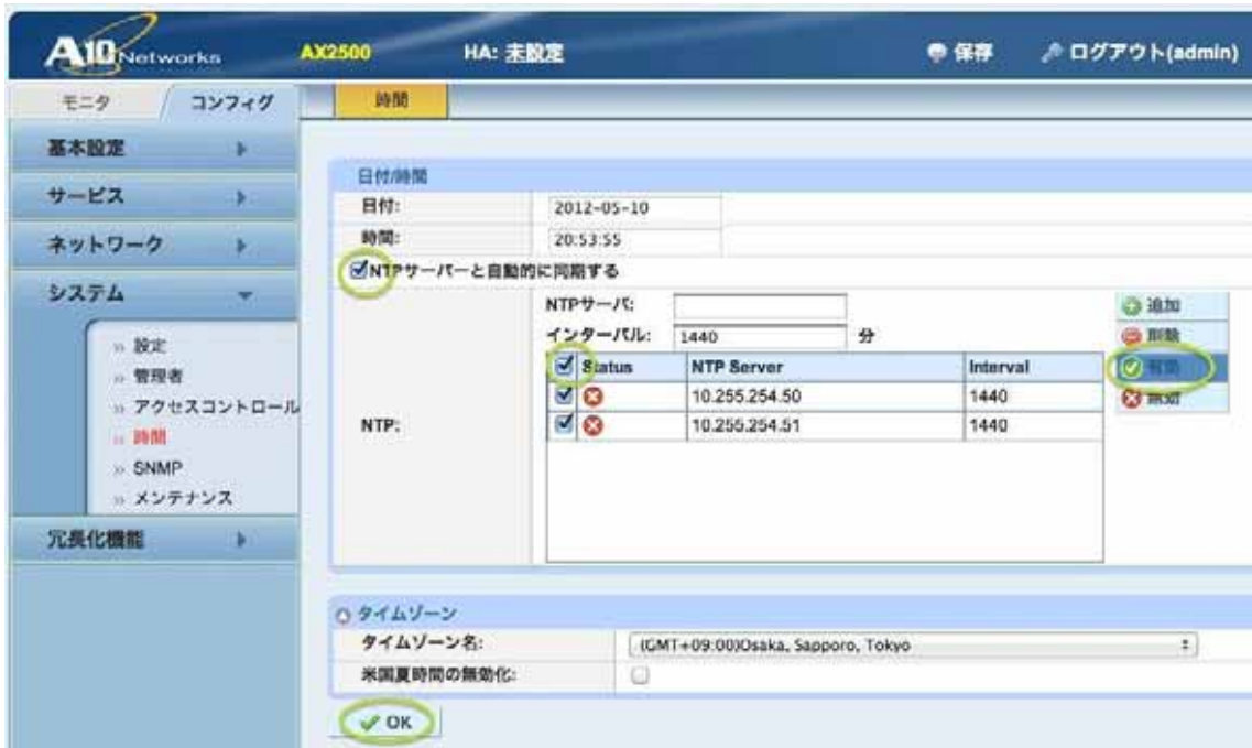
図3.1 NTP同期有効化前の画面