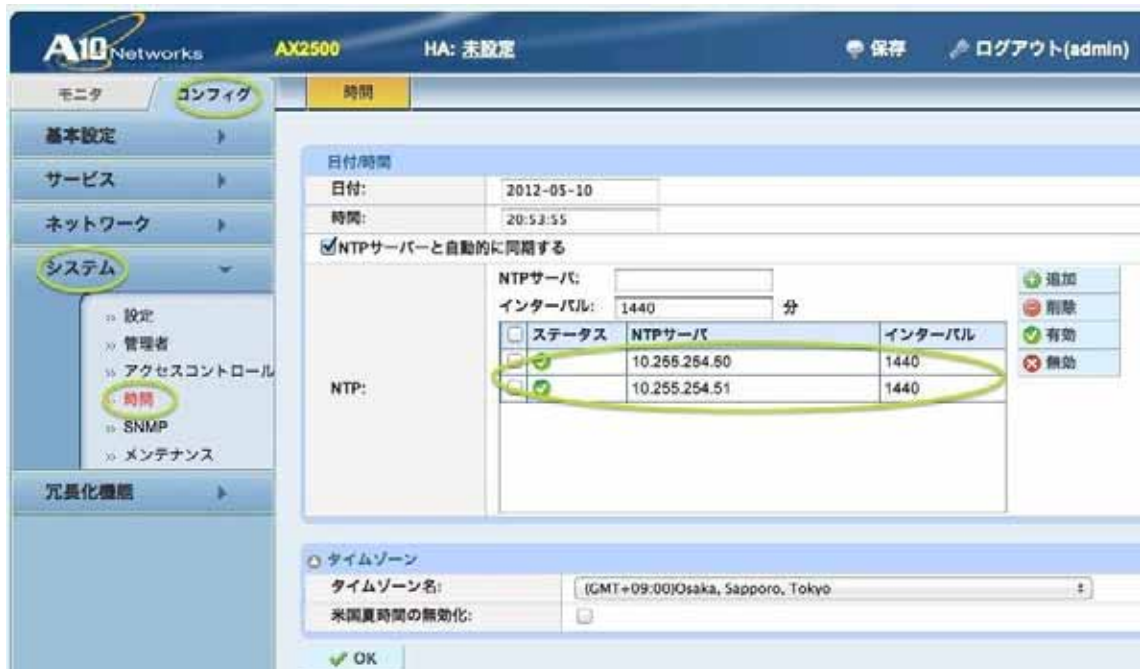
図 1 . 2 NTP 同期有効化の場合