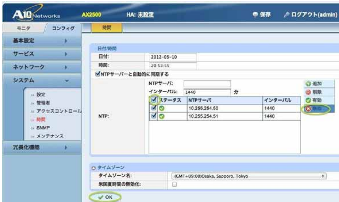
図 2 . 1 NTP 同期無効化前の画面