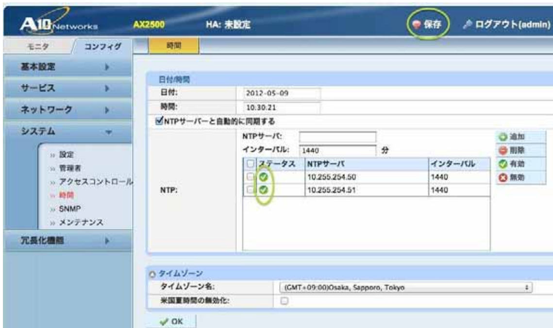
図3.2 NTP同期有効化後の画面